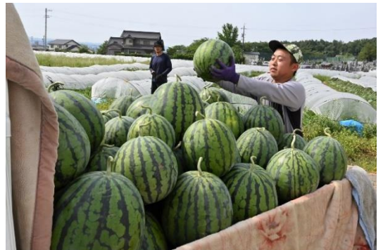
▲大きく育ったスイカの収穫を撮影できます