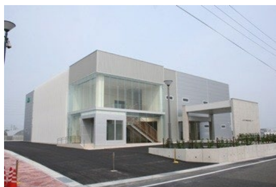
総合支援センター（弥富市）