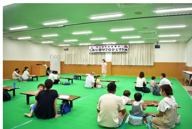
▲昨年の「おにぎり」プロジェクトの様子