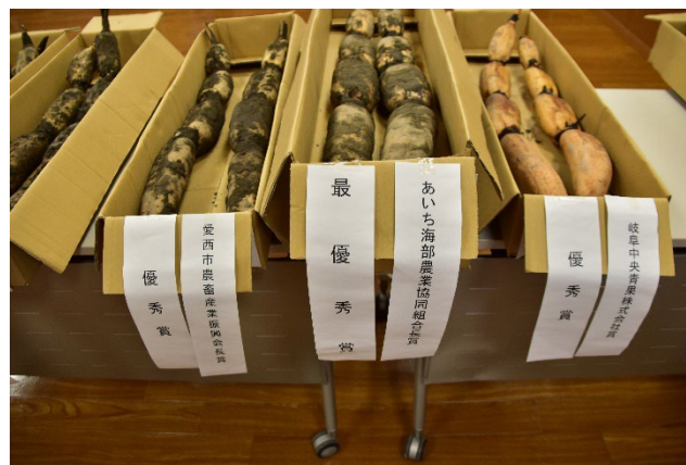
昨年は114点が出品されました